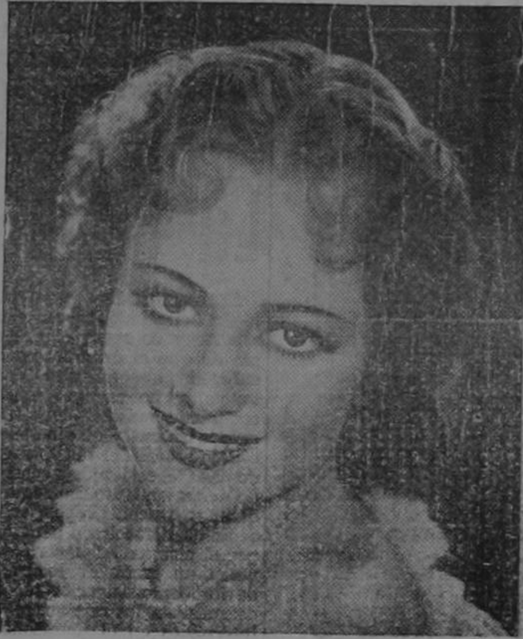
OLIVIA DE HAVILLAND

Viste elegantísima, pero con extremada sencillez. Concorre a los conciertos y fiestas de arte,