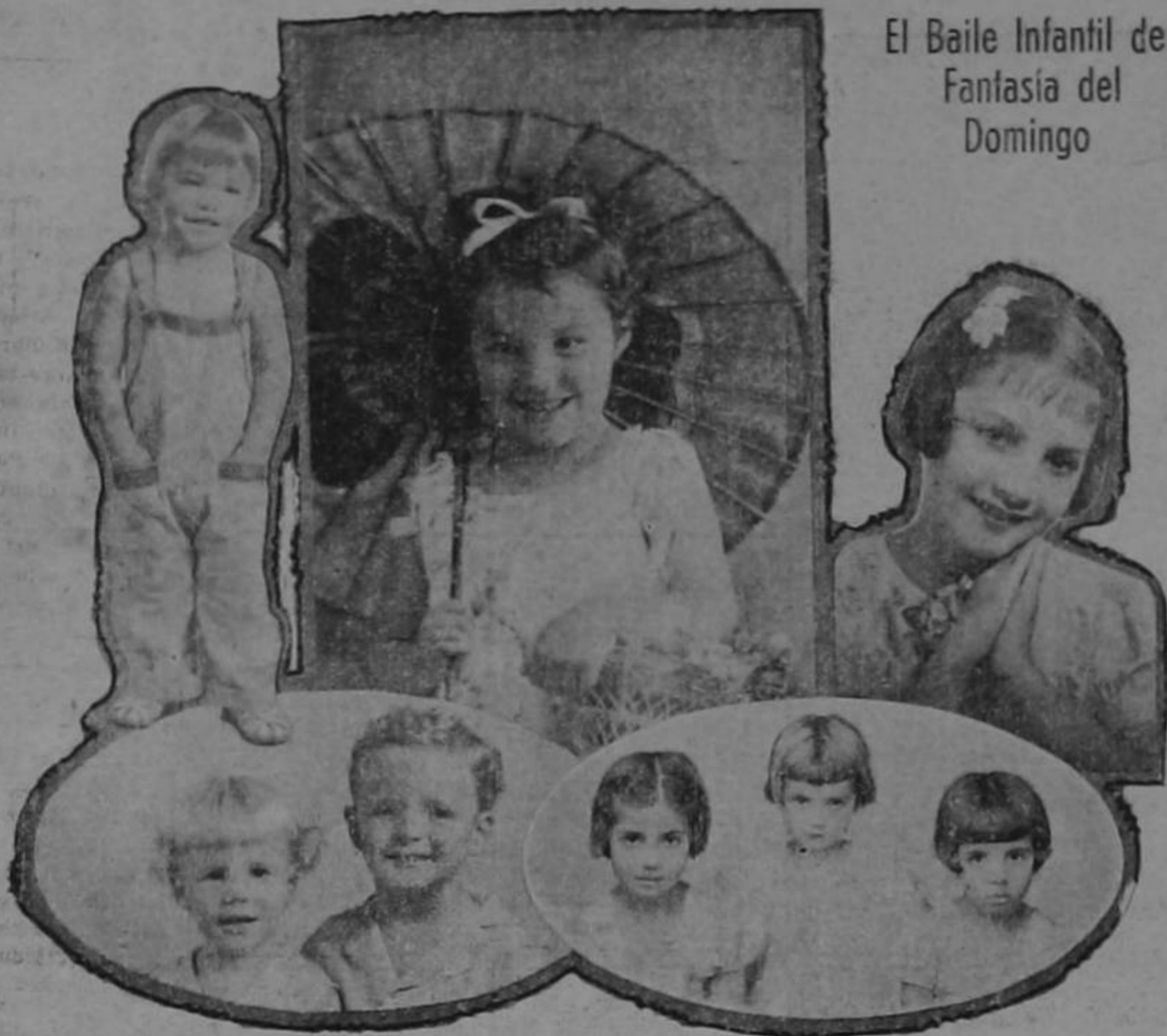
El Baile Infantil de Fantasia del Domingo